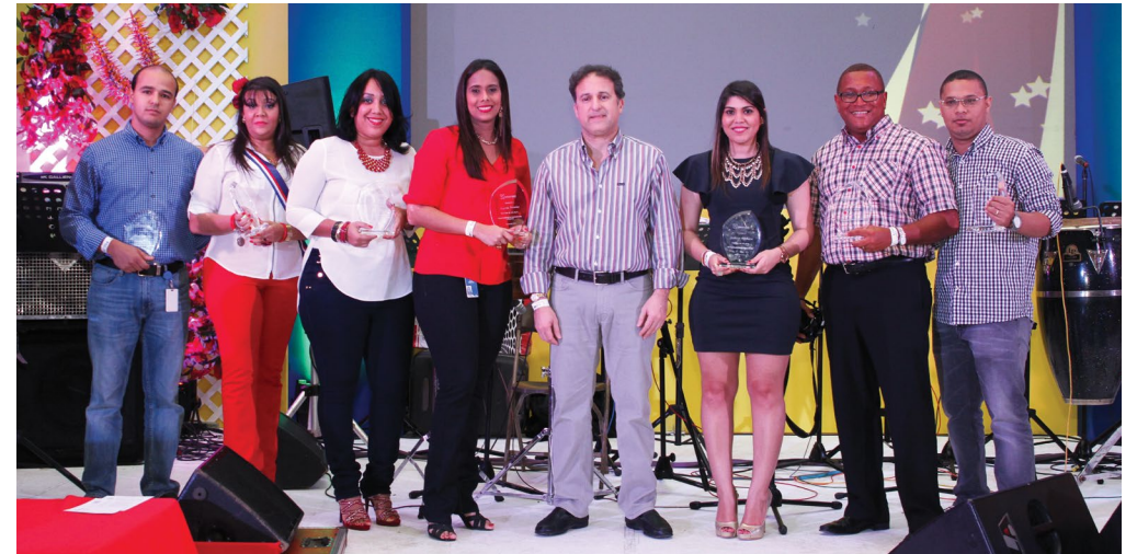
Gerencia de Servicios Generales, ganadores por su excelente servicio interno.